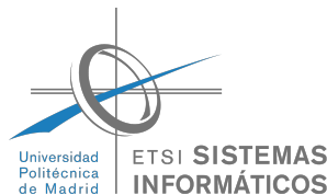
Figura B.3. Logo de la ETSISI utilizado en la cubierta trasera de la memoria

La ETSISI tiene configurados como colores principal y de link el RGB (0, 177, 230). El logo es el mostrado la figura B.3.