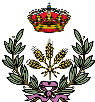
Figura B.1. Logo de la ETSIAAB utilizado en la cubierta trasera de la memoria

La ETSIAAB tiene configurados como colores principal y de link el RGB (99, 178, 76). El logo es el mostrado la figura B.1.