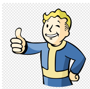
Figura 4.1. Vault Boy approves that