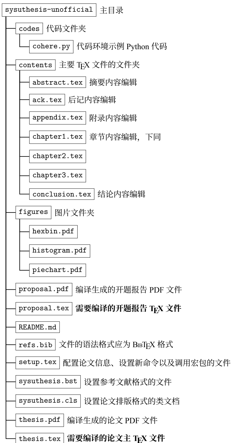
图 1-1: 本模板的文件目录