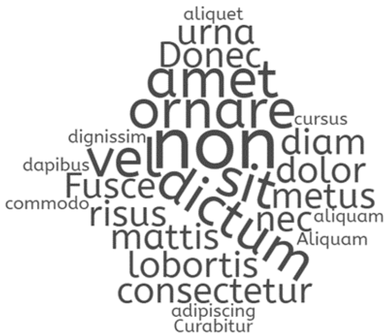
Word Cloud of Lorem Ipsum Paragraph

Quisque enim. Proin velit neque, tristique eu, eleifend eget, vestibulum nec, lacus. Vivamus odio. Duis odio urna, vehicula in, elementum aliquam, aliquet laoreet, tellus. Sed