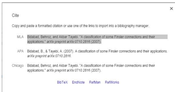
شکل ۲-۲: پنجره‌ی باز شده در گوگل اسکولار

در اینجا ما به گزینه‌ی چهارم یعنی Cite احتیاج داریم. بر روی آن کلیک کرده و پنجره‌ای مانند شکل ۲-۲ باز می‌شود که دارای ۴ گزینه‌ی زیر است: