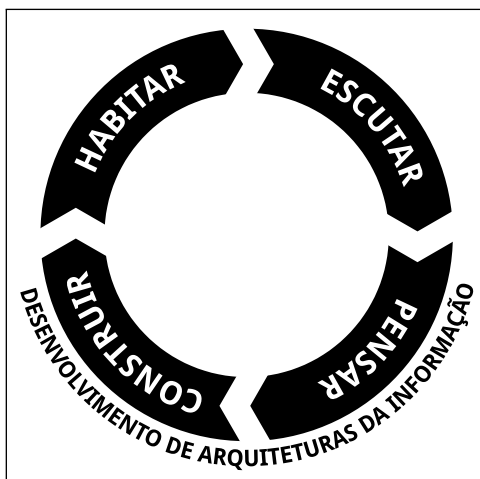
Figura 1 – Método de Arquitetura da Informação Aplicada – MAIA

A metodologia utilizada para o desenvolvimento do projeto utilizará o Método de Arquitetura da Informação Aplicada (MAIA) (COSTA, 2010), cujo conceito simplificado é apresentado na Figura 1 .