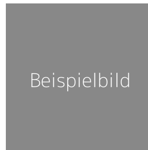
Abbildung 2.3: Wrapped figure in den Satzbau

Morbi sed elit sit amet ante lobortis sollicitudin. Nunc quis urna dictum turpis accumsan semper. Lorem ipsum dolor sit amet, consectetur adipiscing elit. Etiam lobortis facilisis sem. Nullam nec mi et neque pharetra sollicitudin. Praesent imperdiet mi nec ante. Donec ullamcorper, felis non sodales commodo, lectus velit ultrices augue, a dignissim nibh lectus placerat pede. Vivamus nunc nunc, molestie ut, ultricies vel, semper in, velit. Ut porttitor. Praesent in sapien. Lorem ipsum dolor sit amet, consectetur adipiscing elit. Duis fringilla tristique neque. Sed interdum libero ut metus. Pellentesque placerat. Nam rutrum augue a leo. Morbi sed elit sit amet ante lobortis sollicitudin. Praesent blandit blandit mauris. Praesent lectus tellus, aliquet aliquam, luctus a, egestas a, turpis. Mauris lacinia lorem sit amet ipsum.