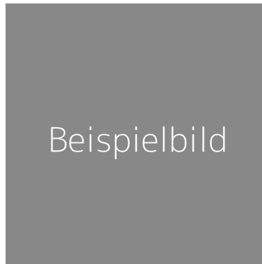
Abbildung 2.1: Klassenhierarchie maschinellen Lernens