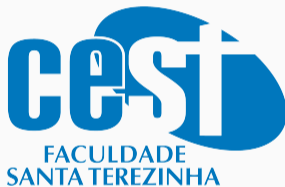
Figura 2: Faculdade Santa Terezinha